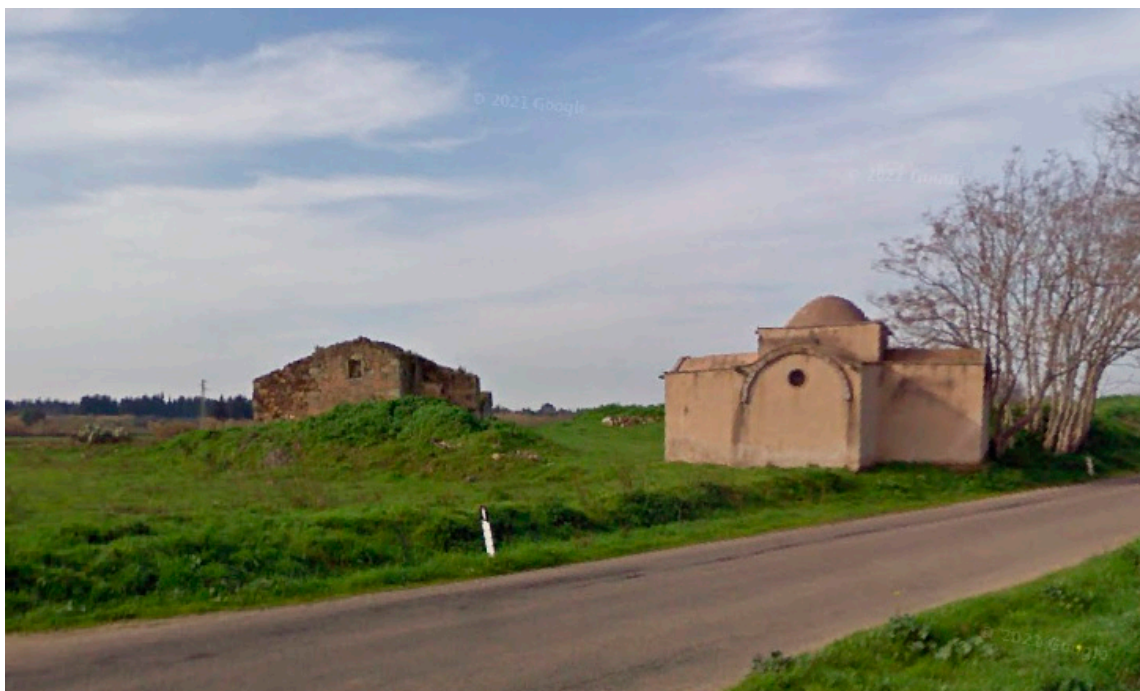
Vista dalla S.P.9 – Chiesa San Salvatore e ex chiesa San Nicola di Myra