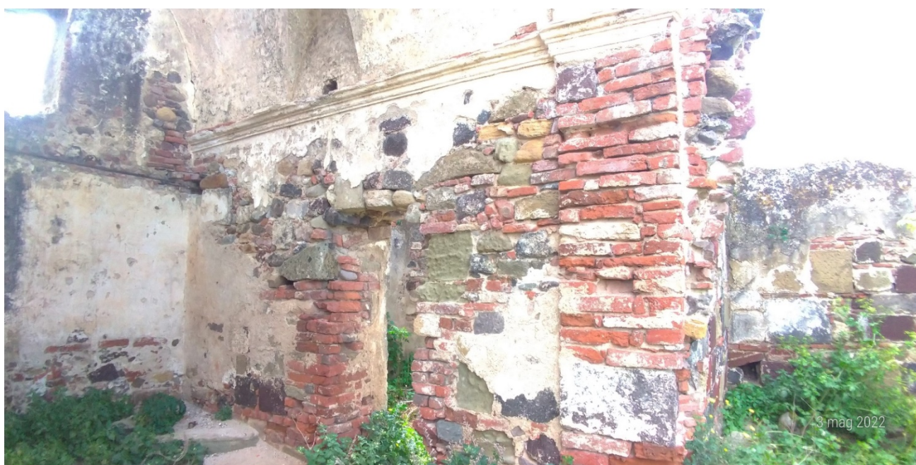
Ex Chiesa San Nicola di Myra (vista delle strutture da mettere in sicurezza)