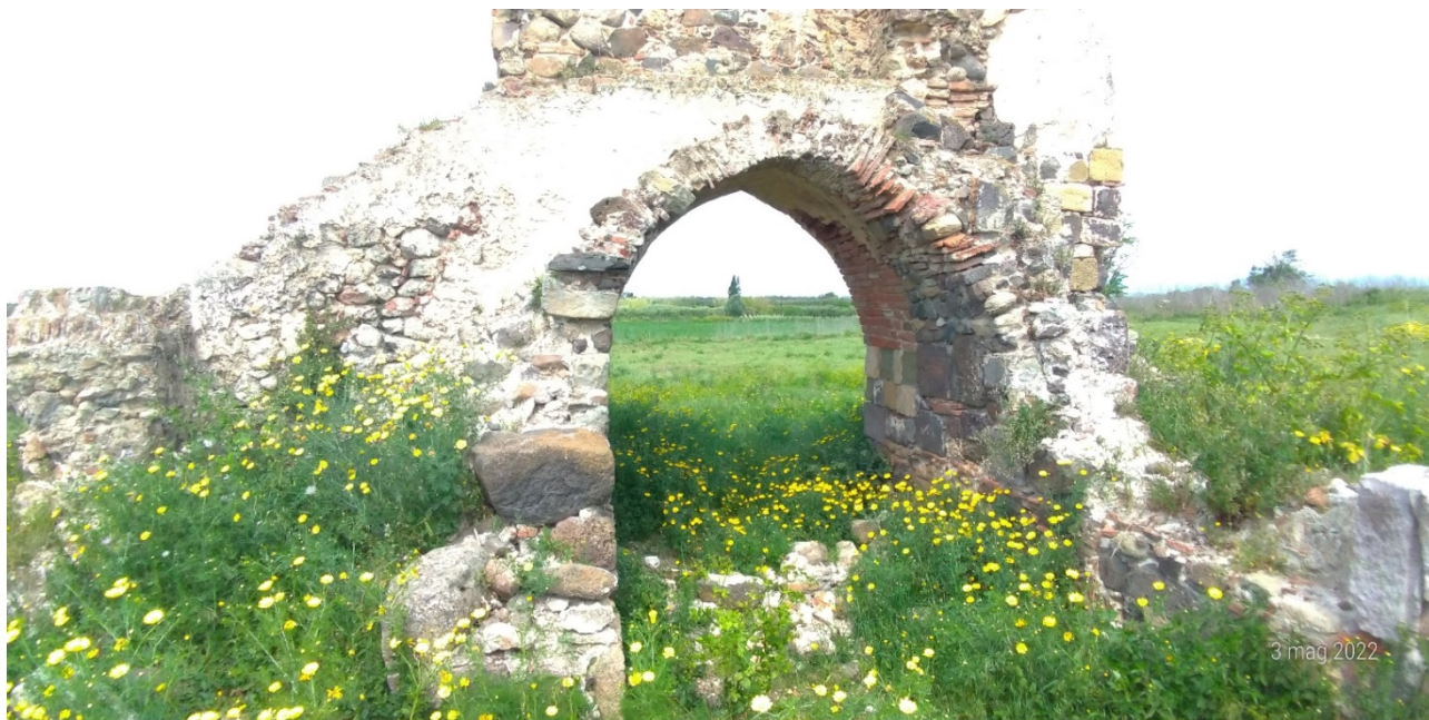
Ex Chiesa San Nicola di Myra (vista delle strutture da mettere in sicurezza)