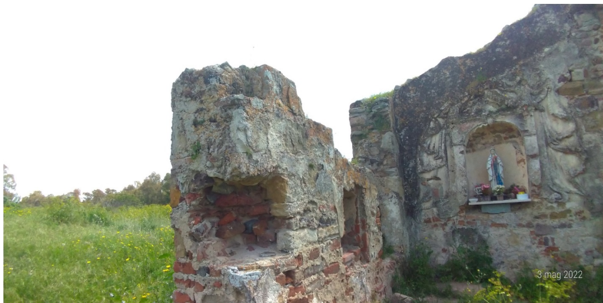
Ex Chiesa San Nicola di Myra (vista delle strutture da mettere in sicurezza)